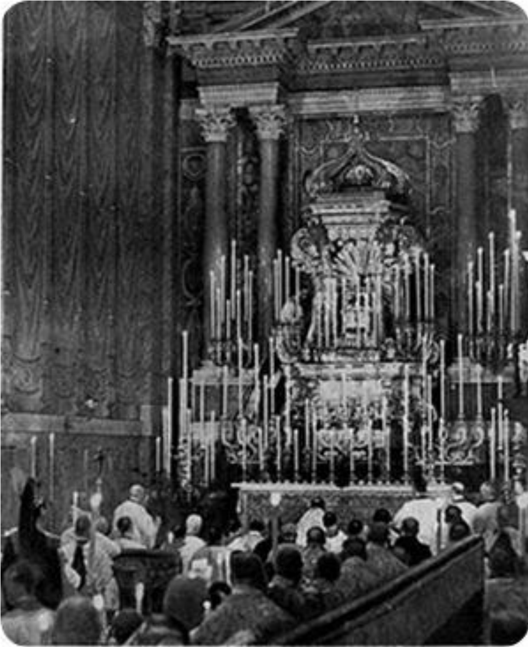
La capilla Paulina durante la época de Pío XI