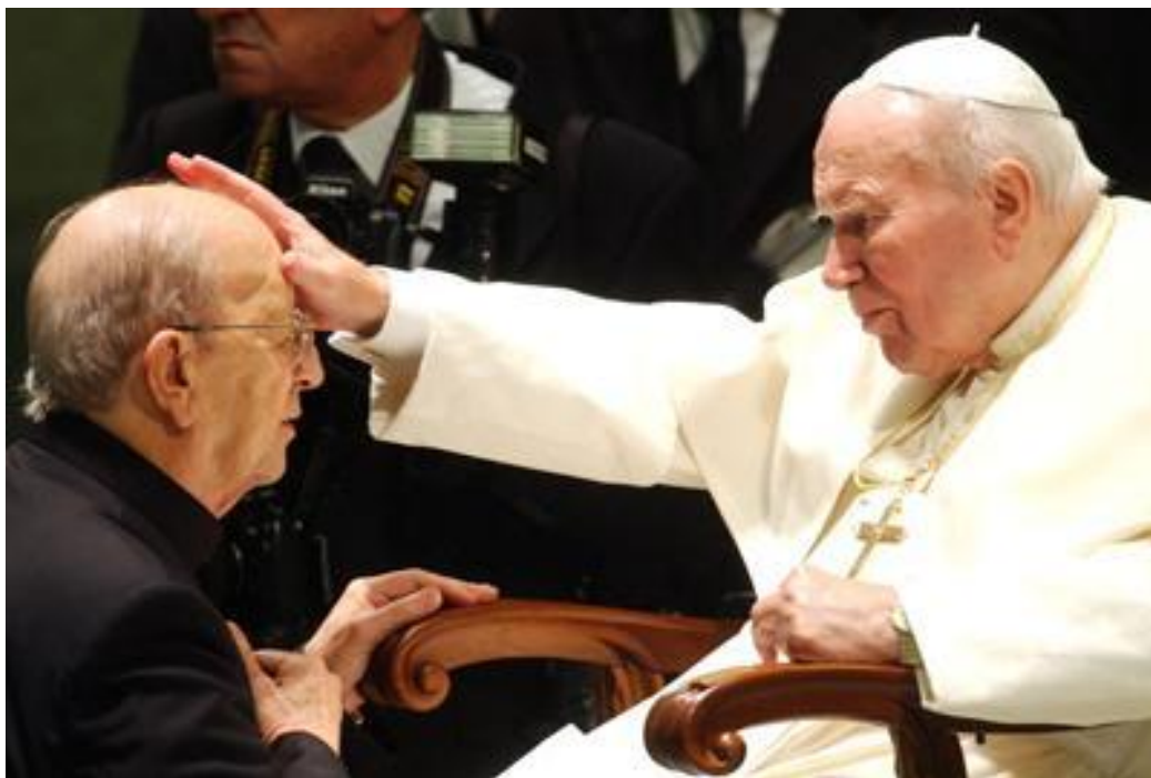
Imagen de Juan Pablo II y Marcial Maciel.

Cita: Maciel, fundador de los Legionarios, ya era pederasta cuando el polaco llegó a papa - Ambos se apoyaron entre sí y compartieron una visión de la Iglesia