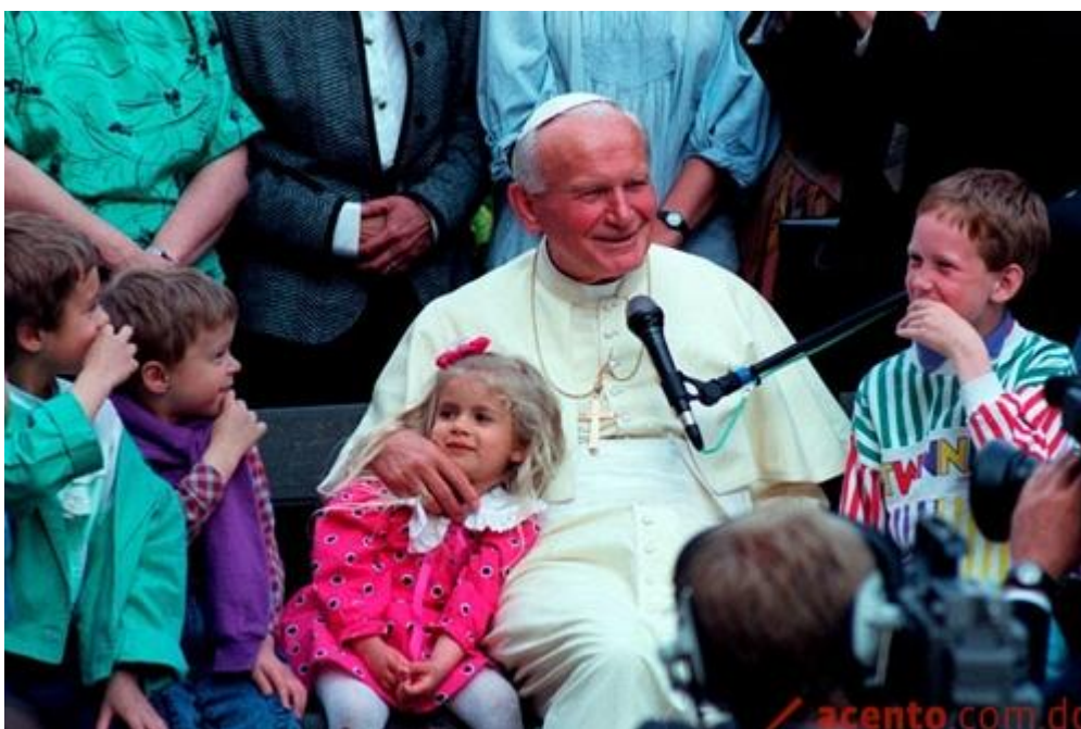
Juan Pablo II junto a un grupo de niños y niñas.