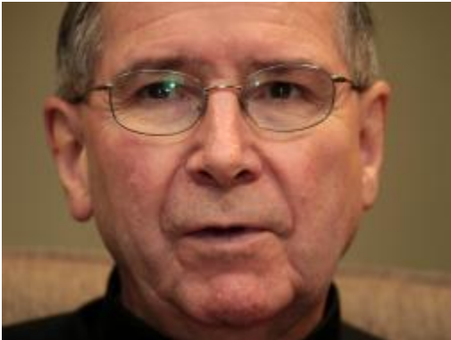
Cardenal de Los Ángeles Roger Mahony.