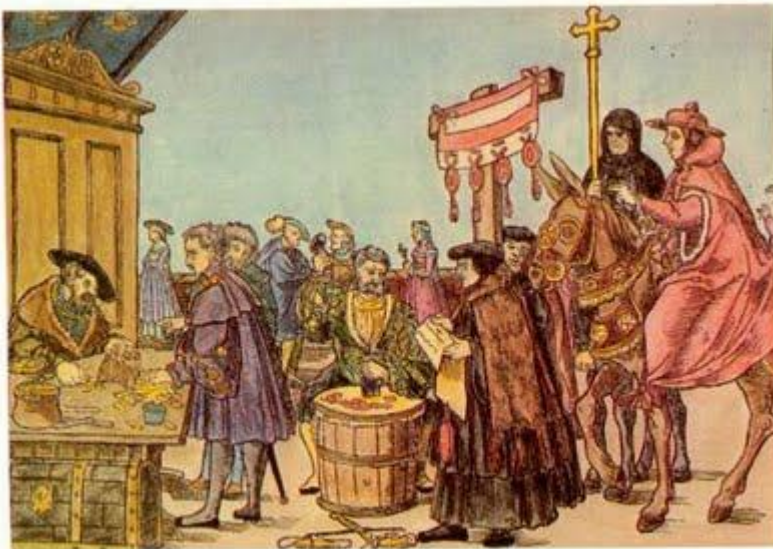
The sale of indulgences by some unscrupulous Church leaders caused Martin Luther to break with the Catholic Church

El año 1516, se convirtio en parroco de la Iglesia de Wittenberg, sobresalio como predicador popular, proclamando la nueva fé. Se opuso a la Venta de Indulgencias (perdon de los pecados a cambio de dinero) comandadas en Alemania por Jhon Tetzel.